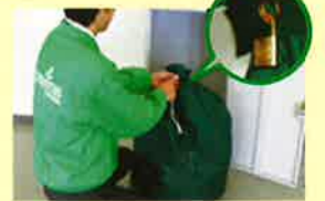
回収（袋に施錠します。）